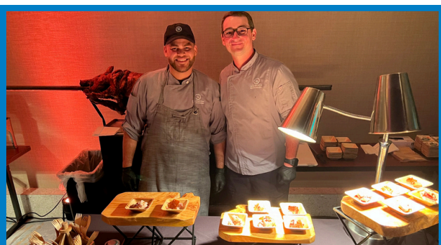
Chefs de Dorado Beach a Ritz - Carlton Reserve