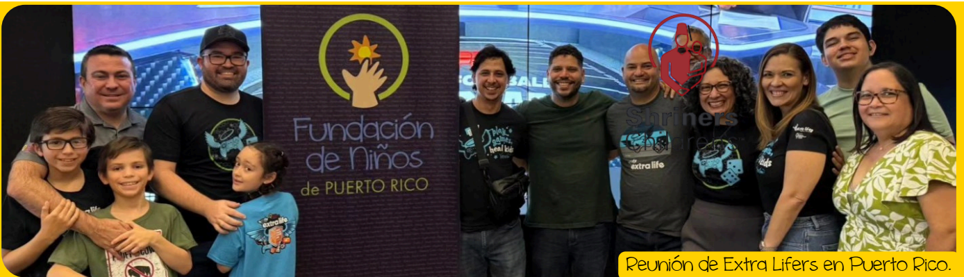
Reunión de Extra Lifers en Puerto Rico.

En octubre celebraron el evento internacional de esport First Attack Puerto Rico , donde dimos a conocer nuestros servicios. Mientras, en noviembre se celebró el Game Day de los Extra Lifers en Puerto Rico y el maratón de 240 horas, a cargo del equipo de Extra Lifers 24/7 . Su apoyo es inigualable. ¡Muchas gracias!